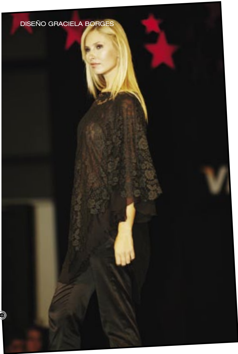
DISEÑO GRACIELA BORGES